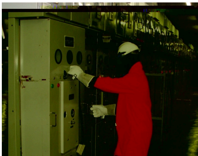
Figura 5 - Operação de equipamento MT - AT em contato indireto em indústria.

Assim, por força do disposto nesse item, os trabalhadores do SEC quando realizam atividades em Alta Tensão em equipamentos ou instalações energizadas, também têm direito à periculosidade, exemplificado na Figura 5, numa operação de disjuntor de MT – AT de 13,8 kV, sendo essa atividade predominante no segmento industrial.