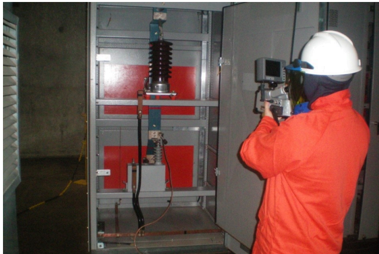
Figura 7 - Atividade de termografia em circuito elétrico de MT/AT – 13,8 kV

A Figura 7 mostra uma atividade de termografia comum em indústrias, realizada em proximidade de circuito elétrico de MT/AT.