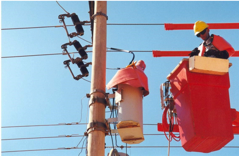
Figura 2 - Atividade linha viva AT – SEP – Concessionária de Distribuição De Energia Elétrica

As Figuras 2 e 3 mostram atividades realizadas em instalações elétricas caracterizadas como no SEP – Sistema Elétrico de Potência, em concessionária de energia elétrica e na indústria.