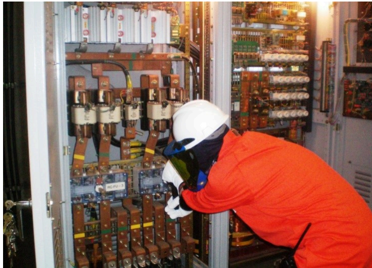
Figure 6 - Atividade em circuito elétrico energizado de BT, sem segregação.

Ocorre que predominam nas indústrias instalações elétricas de BT sem segregação adequada para proteção ao risco de choque elétrico, ou seja, sem Grau IP mínimo 2X (NBR 6146 - Invólucros de Proteção) , expondo os profissionais ao risco de choque elétrico por contato direto, bem como sem proteção adequada ao risco de arco elétrico, caracterizando dessa maneira "risco acentuado" e consequente direito ao adicional de periculosidade para aqueles que realizam atividades dentro da ZR dessas instalações elétricas, vide Figura 6.